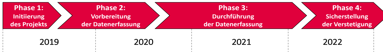
Zeitplanung des Projekts „PlanDigital“

Die Digitalisierungsoffensive für raumbezogene Fachdaten in Niedersachsen